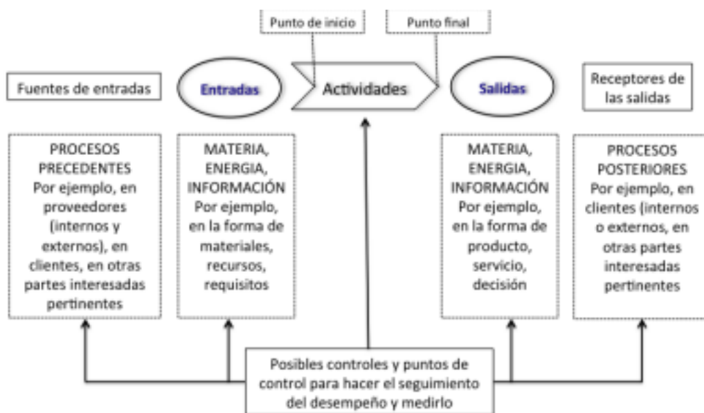
Figura 1 - Representación esquemática de los elementos de un proceso