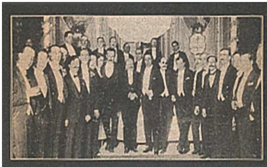
El Poder Judicial era el único de los poderes que no tenía edificio propio. Para en-

El clima intelectual estaba cambiando, al ímpetu por imitar el esfuerzo de esos "ilustres que nos dieron patria e instituciones", se sumaba la revisión de lo que habíamos evolucionado como sociedad luego de un siglo de historia constitucional y jurídica. Ese año se incorporaba la estadística del movimiento de los tribunales y se enfrentaba con sinceridad lo que estaba pendiente, principalmente la autonomía presupuestaria del Poder Judicial.