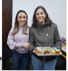
Equipo de Dirección

¡Gracias a quienes colaboraron y se sumaron a este gesto para recordar y celebrar una vez más nuestra Independencia!