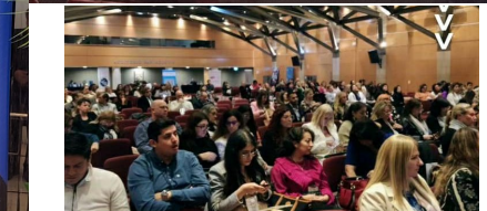
CONFERENCIA DEL COLEGIO DE ESCRIBANOS DE LA PROVINCIA DE BUENOS AIRES