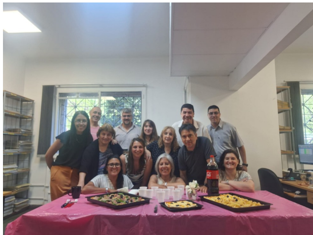
Área Control de la Prioridad

Durante la feria judicial, algunos integrantes del Registro, organizaron su festejo del día del amigo.